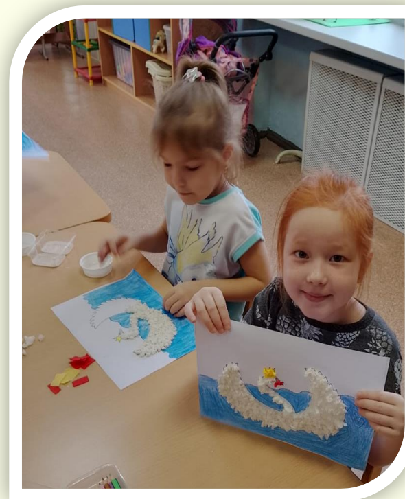
Объемная аппликация «Царевна Лебедь»